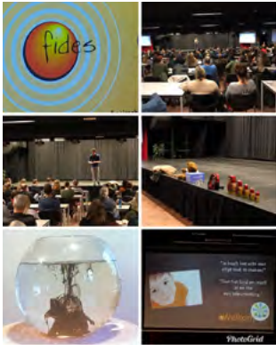
bs Het Molenveld @bshetMolenveld

Een druk bezochte ouderavond over #fides Ouders en leerkrachten zorgen immers samen voor de kinderen @bshetMolenveld @SAAMscholen