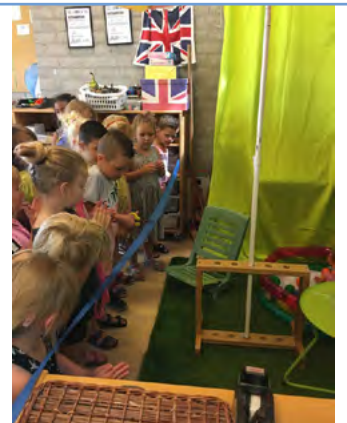
De kleuters openen samen het nieuwe IPC thema Water.

We leren en werken in betekenisvolle verbinding met elkaar en met de werkelijkheid om ons heen. Elke school is verbonden met de wijk of het dorp. Scholen kiezen een eigen schoolconcept of profilering. We waarderen diversiteit. Een school is een democratische gemeenschap en draagt bij aan de maatschappij. We zijn samen verantwoordelijk voor de school en stichting. We voelen ons er veilig.