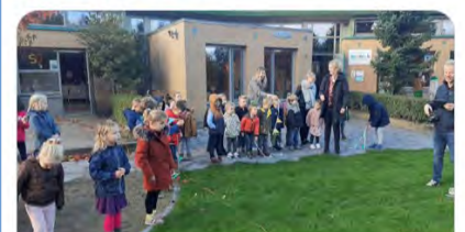
Feestelijk moment op basisschool De Bolderik in bd.nl

OBS De Bolderik · 26-10-2020 ... Feestelijke start na de herfstvakantie! @DeBolderik @SAAMscholen