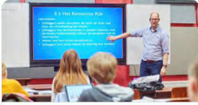
Hoogbegaafde kinderen uit groep 8 krijgen nu al wekelijks... bd.nl

OBS De Bolderik · 17-11-2020 ... Dit mooie project Delphi is voortgekomen uit onze pilot met @bernrode! Wij zijn blij met deze innige samenwerking @DeBolderik @SAAMscholen!