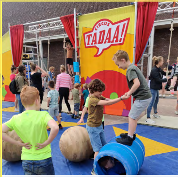
Tijdens De Wizzertdag werden mooie talenten van onze kinderen zichtbaar. Met trots werden deze tijdens de voorstelling aan ouders vertoond.

We vieren mijlpalen, delen momenten en creëren herinneringen. We zien met optimisme uit naar de toekomst en hebben plezier in ons werk.