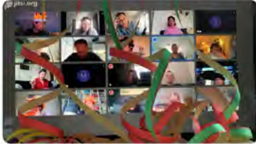
17 apr. 20 om 22:13 · Twitter for Android

De vrijdag (heel laat in de) middag-borrel des vrijdagmiddagborrels. Met het fantastische team van @obsdeieme Een heerlijk begin van de meivakantie! @SAAMscholen