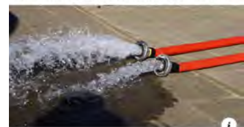
Flinke schade na wateroverlast bij OJBS De Ieme in Veghel - Meierijstad

Update Echt ongelooflijk. Zouden diegenen die dit gedaan hebben, weten hoe groot de impact hiervan op iedereen is? Op het team dat zich de afge... See More