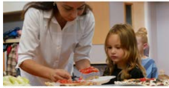
Oliwka (rechts) kiest een lekker gebakje uit.