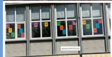
Basisscholen weer open, maar lestijden variëren